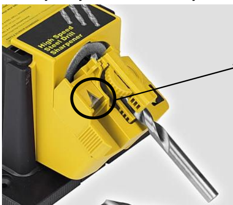
Vodítko ve tvaru V